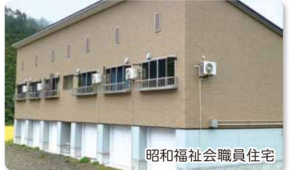
昭和福社会職員住宅